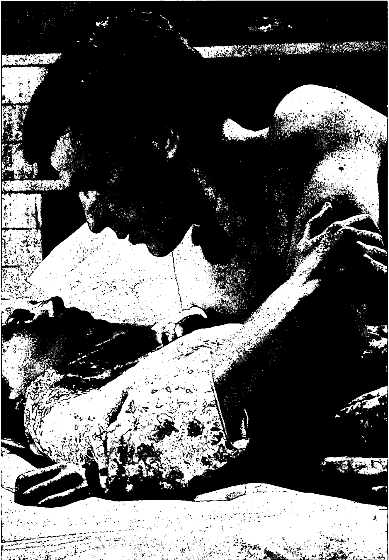
• Rosemary's Baby • : Mia Farrow et John Cassavetes